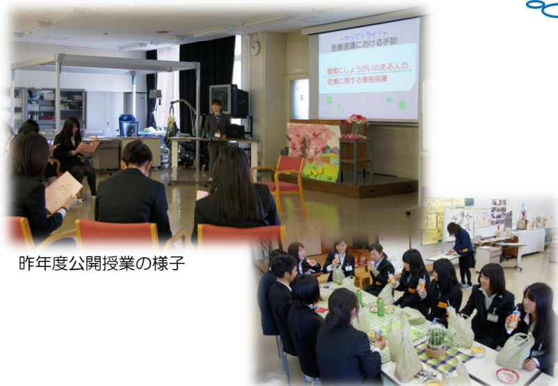
昨年度公開授業の様子