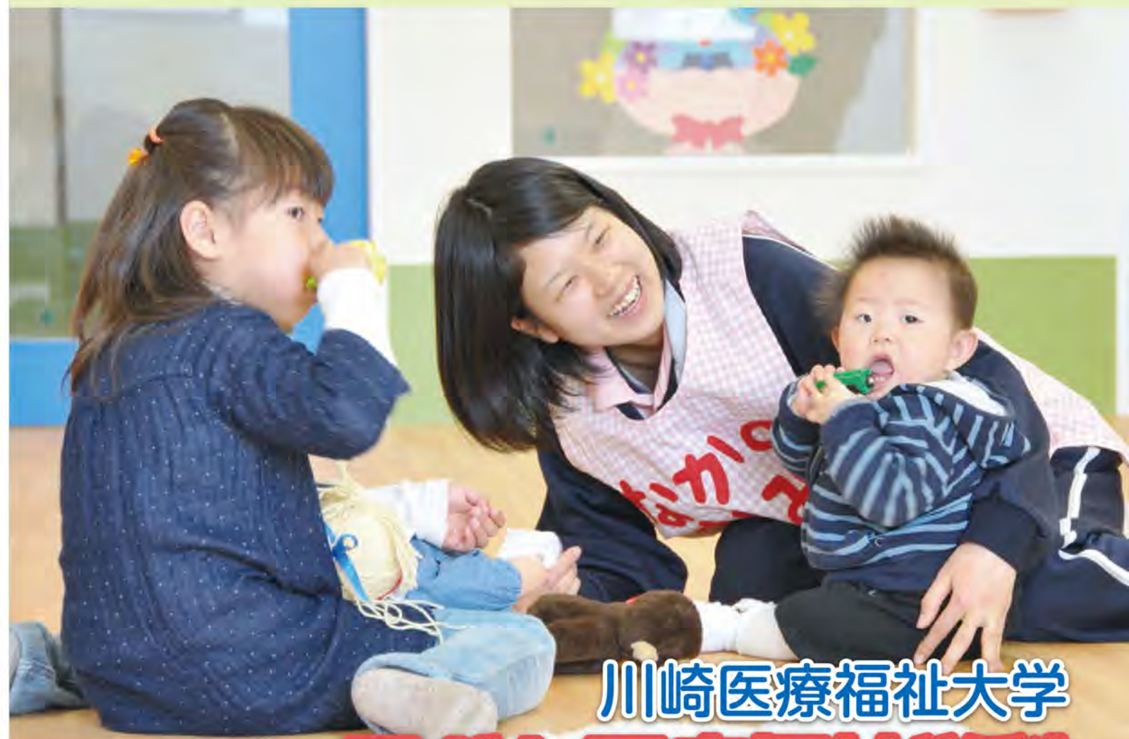
川崎医科大学附属病院病児保育室の様子

川崎医療福祉大学 子ども医療福祉学科 平成29年4月開設予定 日本初! 医療保育科が進化!